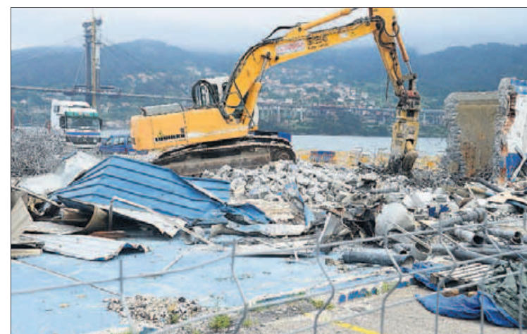
Labores de desescombro en Fandicosta.

La nueva nave tendrá 10.000 metros cuadrados de superficie, a los que hay que sumar los 3.000 metros cuadrados de la primera planta. El frigorífico dispondrá de 33.000 metros cúbicos de capacidad, que equivalen a unas 10.000 toneladas. La intención de la compañía es de culminar las obras en marzo de