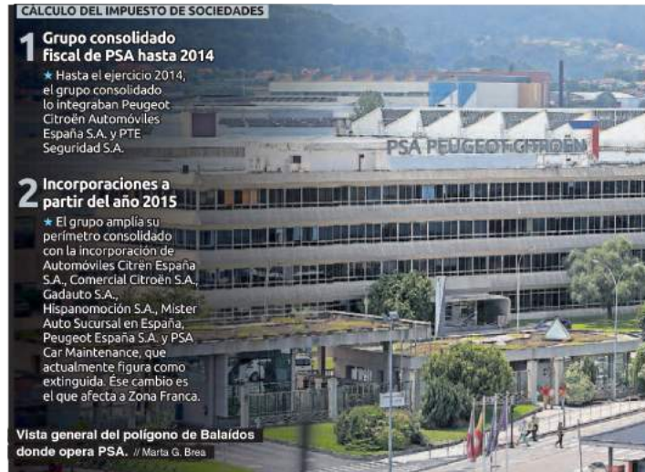
Vista general del polígono de Balaídos donde opera PSA.

En concreto, en la nota enviada ayer, el Consorcio detalla que hasta 2014 el grupo consolidado fiscal estaba integrado por Peugeot Citroën Automóviles España S.A. y PTE Seguridad S.A. y que a partir de enero de 2015 se incorporaron al grupo consolidado sociedades que operan fuera del recinto franco como Hispanomoción S.A. (concesionario de la avenida de Madrid), Gadauto S.A. (Oleiros), PSA Car Maintenance, Comercial Citroën S.A., Automóviles Citroën España S.A., Mister Auto Sucursal