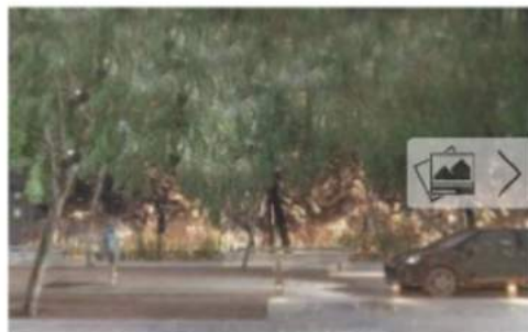
Infografía del nuevo proyecto de humanización de la Alameda.

La transformación de la Alameda comenzará este miércoles con el levantamiento de los adoquines de la calzada, que serán reemplazados por asfalto impreso de última generación. La obra fue adjudicada a la constructora Civis Global S.L., por 914.967,53 euros (con una baja de casi 300.000 euros con respecto al presupuesto de licitación) y obligará a cortar al tráfico la Plaza de Compostela a partir de mañana, miércoles (10.00 horas), en el tramo entre Colón y Cánovas del Castillo por un periodo aproximado de seis meses. Los desvíos se establecerán por Concepción Arenal y Luis Taboada para el servicio público y residentes y mientras dure el cierre se establecerá sentido único en la calle Luis Taboada hacia García Olloqui para autobuses y residentes, según anunció el Concello.