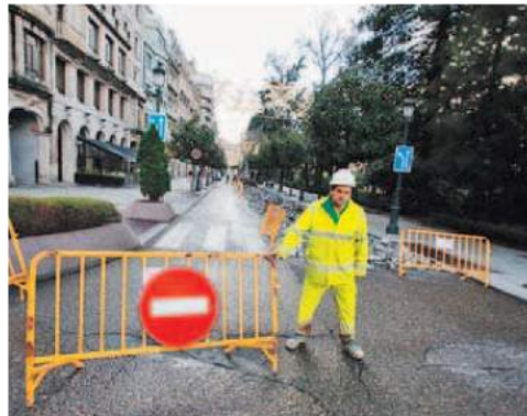
El adoquinado entre Colón y Cánovas ya es historia. ÓSCAR VÁZQUEZ

El corte comenzó ayer por la mañana en el tramo comprendido entre Colón y Cánovas del Castillo. No obstante, la Policía Local estableció un plan de tráfico alternativo para facilitar el tránsito de transportistas y residentes. Estos conductores ten-