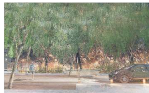
Infografía del nuevo proyecto de humanización de la Alameda. // Fav

Las obras de pavimentación de García Oloqui y Plaza de Compostela, que se desarrollarán en tres fases a lo largo de seis meses, supondrán una mejora considerable en cuanto a reducción de ruidos y también en coste y mantenimiento dado que el asfalto impreso reemplazará a los adoquines actuales. Las molestias por exceso de ruido y vibraciones que causan los vehículos al transitar por los adoquines en una zona en la que la velocidad está limitada a 30 kilómetros por hora provocó una denuncia por los vecinos