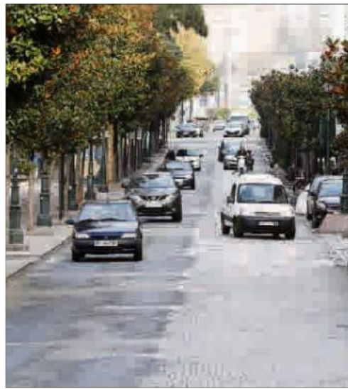
Varios parches sobre el empedrado de Plaza de Compostela.

no tiene aún el plan alternativo de desvíos, probablemente el túnel de Beiramar se convertirá en la principal alternativa para poder llegar desde La Palleira al entorno de A Laxe. El corte afectará además a varias líneas de autobús.