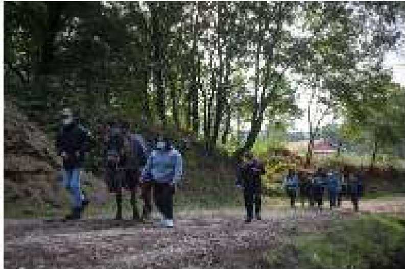
100 personas participarán en el camino de 124 kilómetros por montaña y bosque

Fecha 17 de octubre de 2020 Fecha de actualización