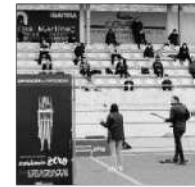
Actuación ayer en A Guarda.

Todas estas medidas fueron consensuadas ayer al mediodía en la reunión celebrada entre el gobierno local y los representantes de los trabajadores. En función de los resultados de esos test de antígenos que se comenzarán a realizar hoy, no se descarta tomar nuevas medidas. Con todo ello, apuntan desde el Ayuntamiento, se busca garantizar la continuidad de la atención al público, y que a su vez se preste con las máximas condiciones de seguridad. El Concello tuiense reitera la solicitud de responsabilidad a la ciudadanía, "extremando las precauciones ante la actual situación derivada de la pandemia del coronavirus".