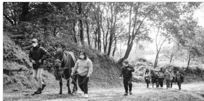
El trayecto se realizó en grupos reducidos y manteniendo la distancia social.

guesa Civis global y el Ayuntamiento de Oia), llegó ayer a la capital gallega e hizo todo el recorrido en grupos de cinco personas para respetar las restricciones marcadas por la pandemia. La iniciativa incorpora los beneficios de la equitación terapéutica para personas con discapacidad y en riesgo de exclusión social. La marcha fue suspendida en marzo debido a la situación sanitaria y partió finalmente el lunes 19 de octubre desde el Monasterio de